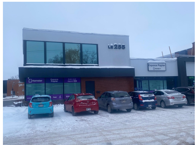
Immeuble vu de côté