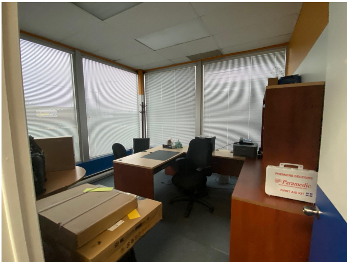
LOCAL 210 - bureau