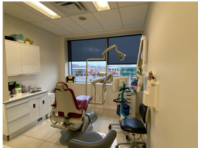
Salle no. 2