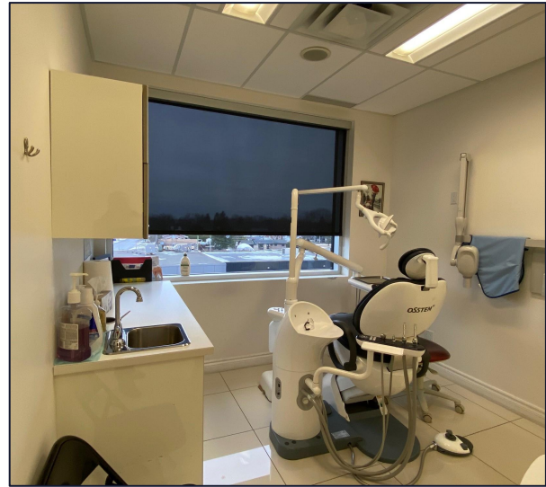
Salle no. 6