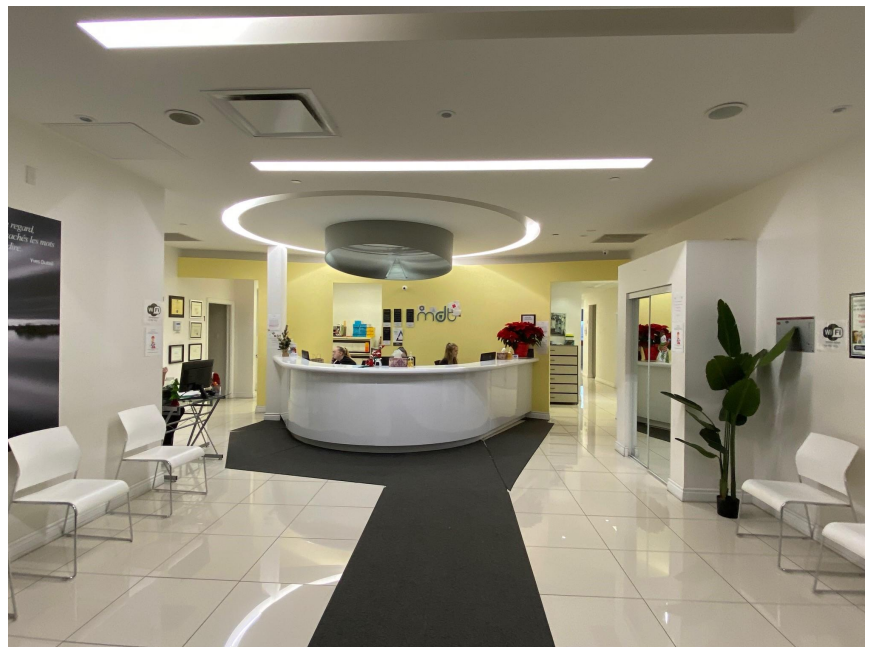
Réception salle d'attente