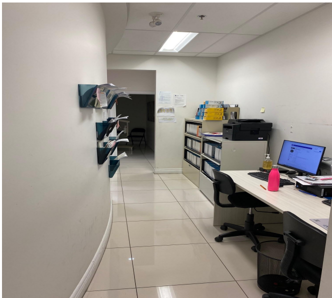
Salle de travail