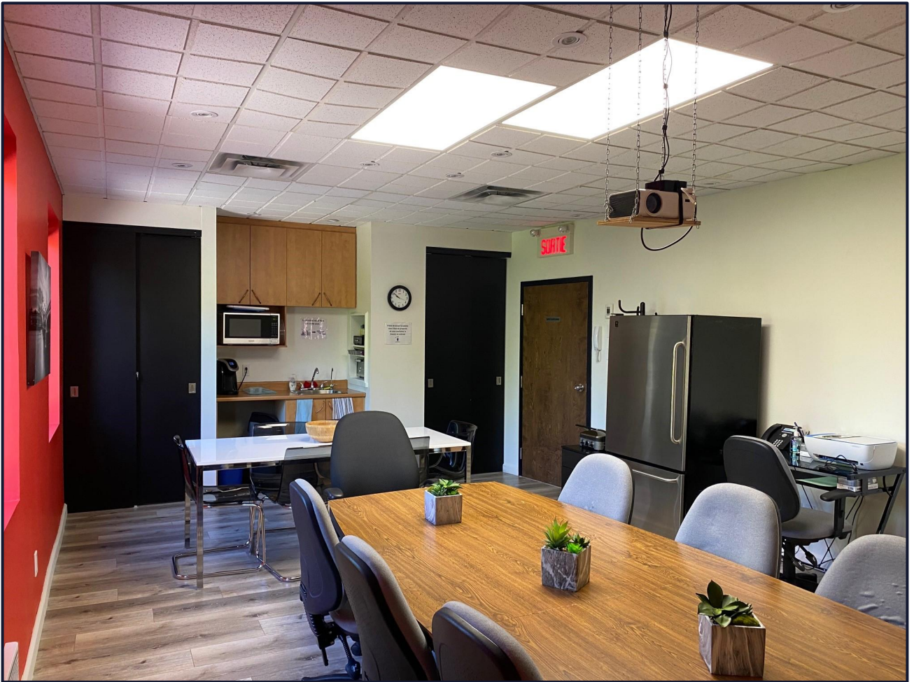
Salle de conférence / Conference room

BLAINVILLE 360, De la Seigneurie, bureau 204-A