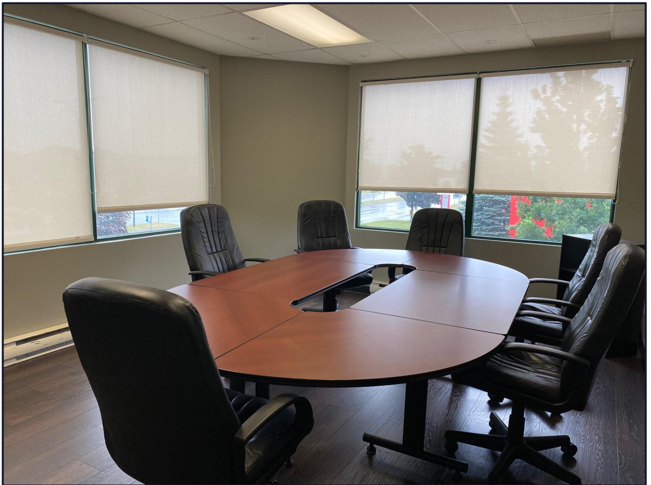
Salle de conférence / Conference room

Note : Rented fully furnished or possibility to rent without furniture.