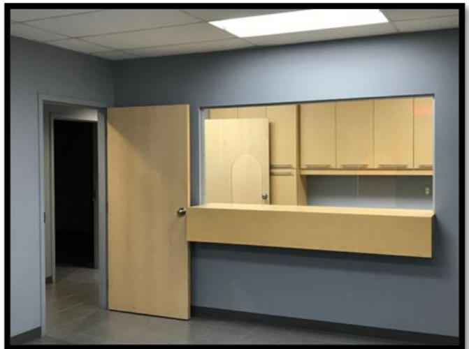
Réception du sous-sol / Basement reception