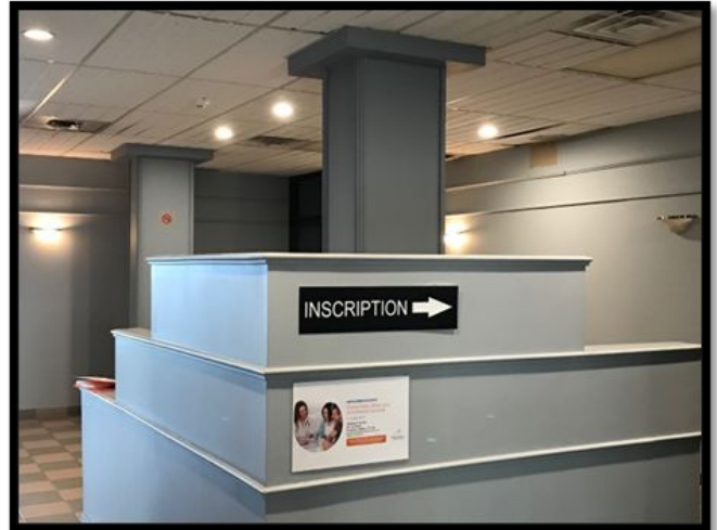
Salle d'attente / Waiting room