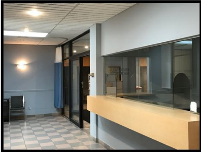
Réception / Reception