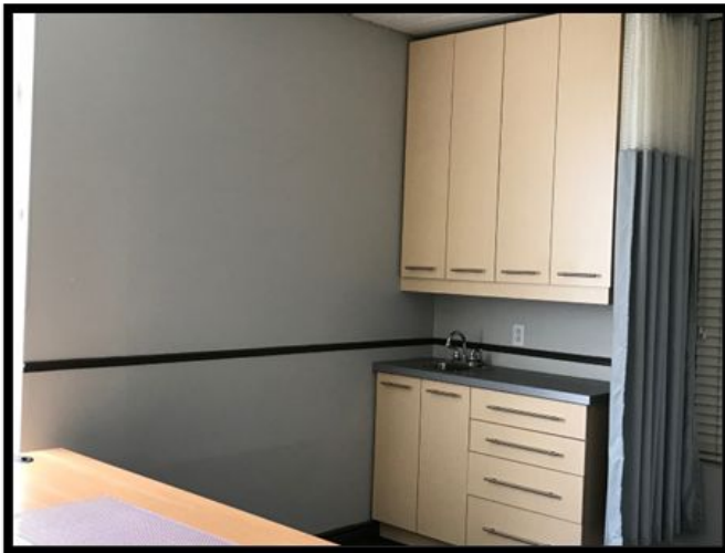
Salle de travail / Work room